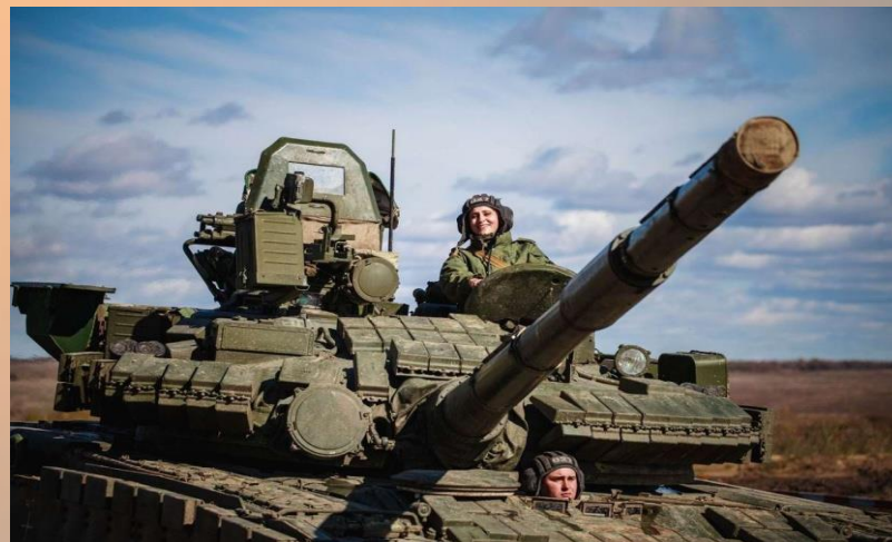
Г.) Танковые войска